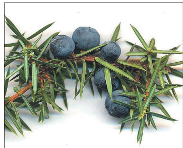
Dr Pfarrer het dr Schnaps vom zvg. Räkhouder nid gärn gha.

Der Pfarrer Ängimaa hingäge het e angeri Idee gha: derzue bruchts Harz. Das isch eigentlech nid gärn gseh worde, oder sogar verbote gsy. D Harzer hei-ge jungi, saftegi Tanne aagschnitte u ds Harz la usloufe. Das Harz isch de ykocht worde («e soumässig grusegi Arbeit», meint dr Pfarrer) u de när de Härsteuer vo Wagesaubi verchouft worde. Vuu z verdiene heigs nid gää, aber die arme Tanne sige ums Wachstum i däm Jahr brunge worde.